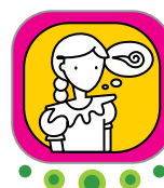
Reflexión de lectura indígena