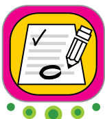
Revisión y corrección de texto