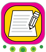
Escritura de texto