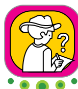
Elaboración del plan de escritura