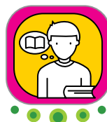
Anticipación de lectura