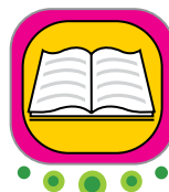
Libro de lecturas