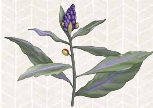
Hierba de la mula