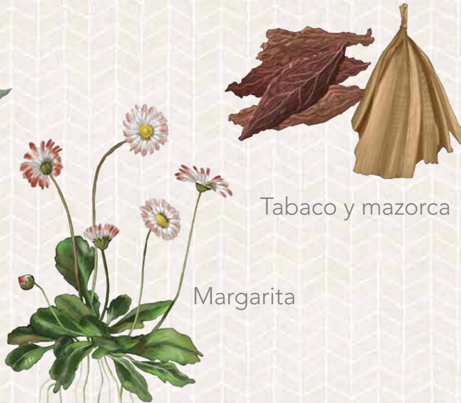
Tabaco y mazorca