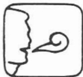
hablar en voz alta