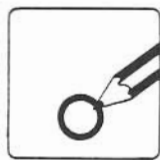
encerrar en un círculo