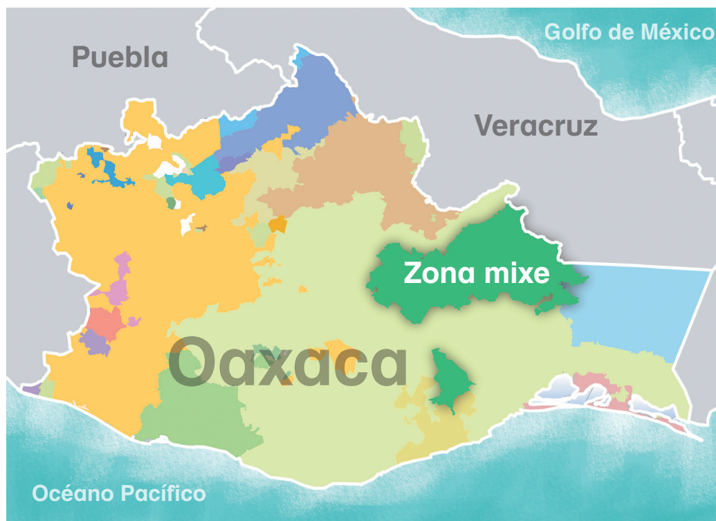
Ubicación geográfica de la región mixe

El área cultural mixe colinda con los exdistritos de Villa Alta, al noroeste; con Choapam y el estado de Veracruz, al norte; al sur con Yautepec y al sureste con Juchitán y Tehuantepec.